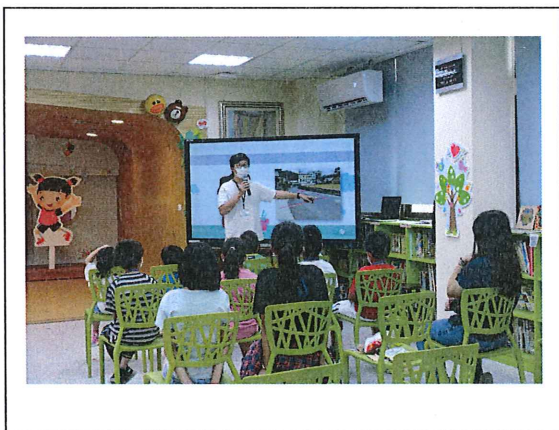
宣導交通安全注意事項