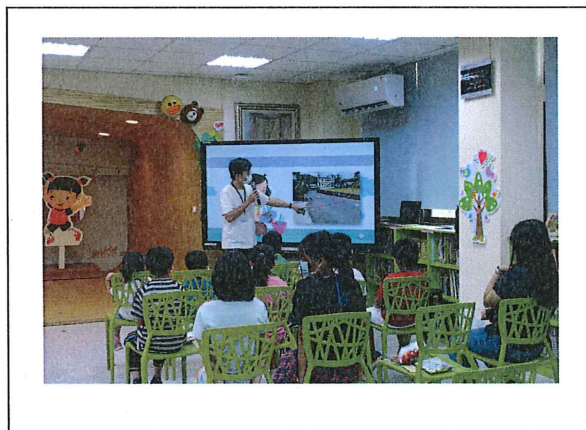
宣導校園附近交通路口事宜